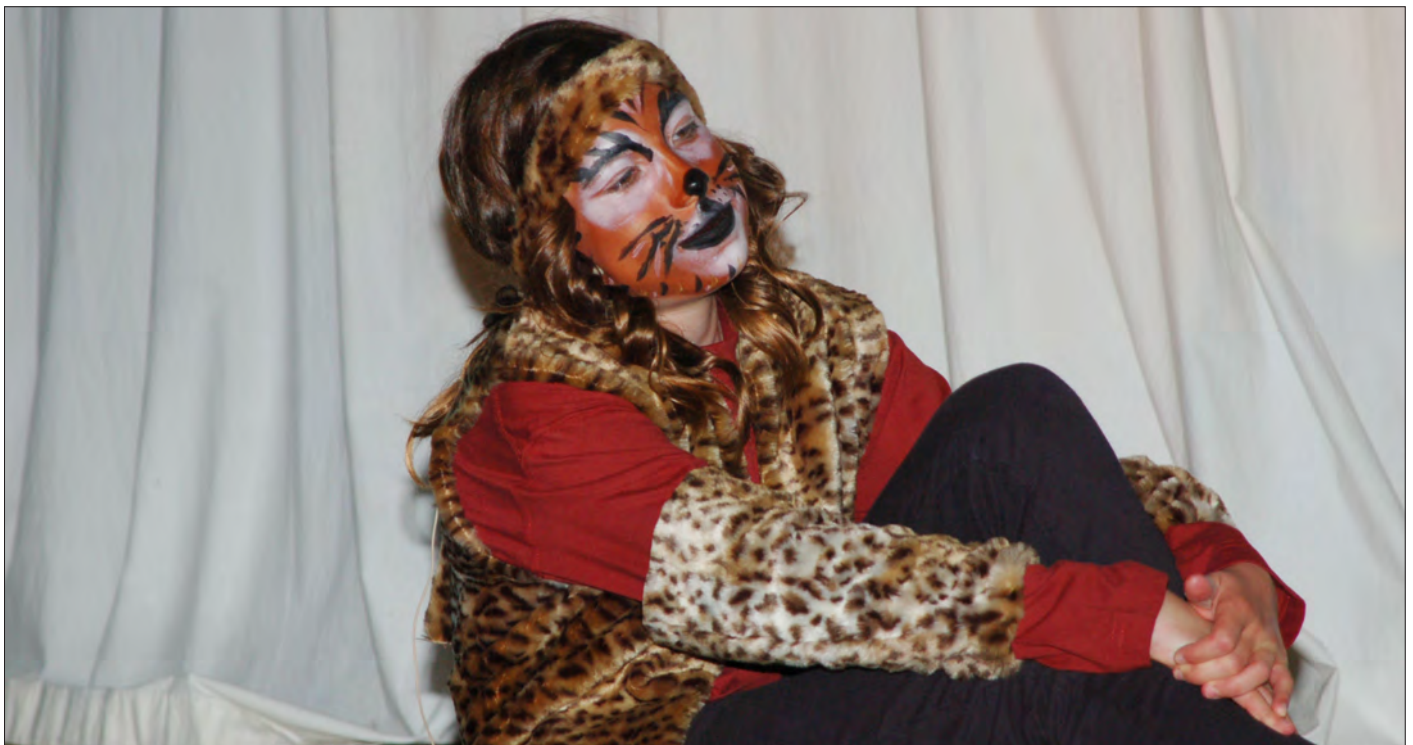
Szene 1: Die Siamkatze Mike hat sich in die Angorakatze Angie verliebt.

Nun wünschen wir Ihnen viel Spaß beim Studieren des Prospekts und viel Erfolg mit Ihrer Aufführung.