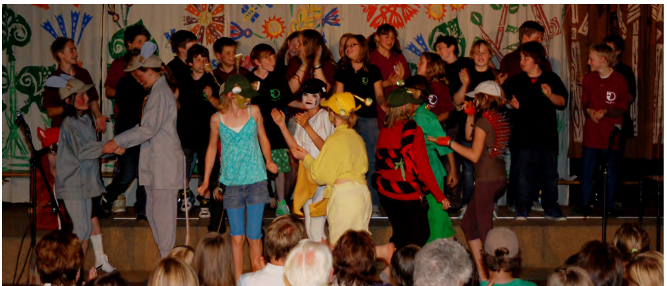
Zum Beispiel: Lied Nr. 10 „Rock and Roll ist hip!“ aus dem Musical „Rotfuchs in der Falle“

Schnuppern Sie auch mal in unsere anderen Musicals rein!