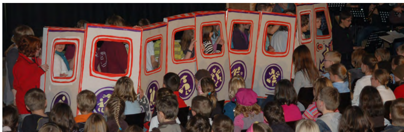
Zum Beispiel: Lied Nr. 5 „Busfahr’n“ aus dem Musical „Hokuspokus Hexenfuß“

Schnuppern Sie auch mal in unsere anderen Musicals rein!