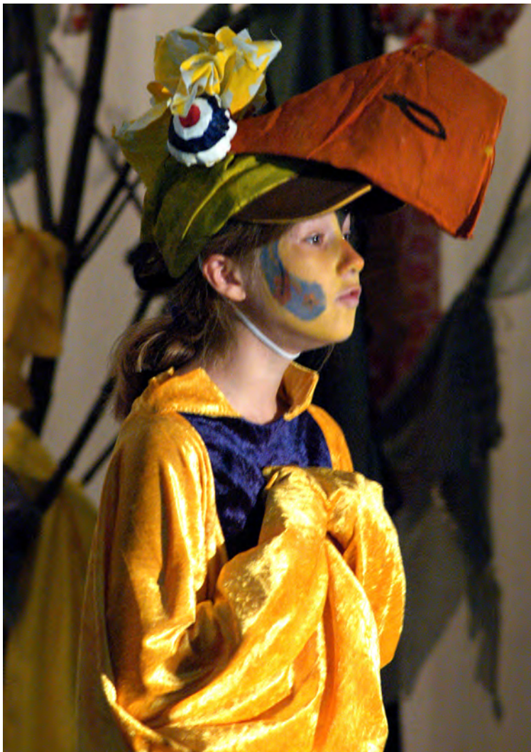
Szene1: Spechti ist aufgewacht und vermisst seine Freunde.

Auf den folgenden Seiten finden Sie nun die einzelnen Musical-Bausteine von „Spechti und die Bergwaldcombo“. Wir wünschen Ihnen nun viel Spaß beim Studieren des Prospekts.